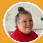
휘투 네이산 박사 수료 중. 교육학 석사, TESSOL 자격증 소지